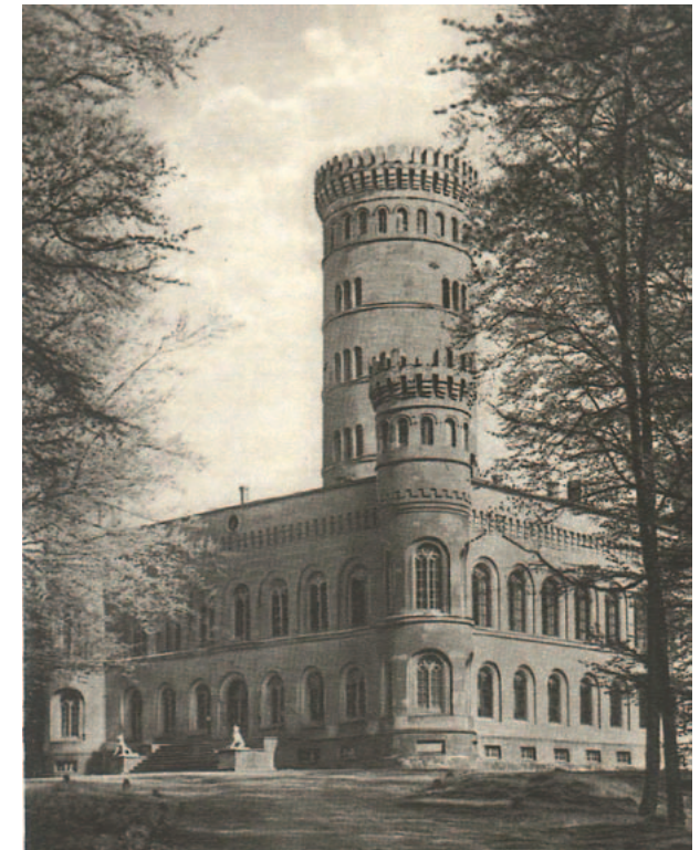
Jagdschloss Granitz um 1940

In der zweiten Hälfte des 19. Jahrhunderts wurde der Tempel wegen Baufälligkeit abgebrochen.