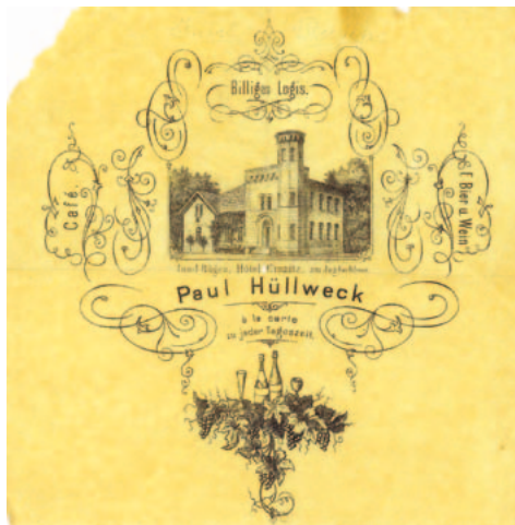
Restaurantserviette vor 1901

In den Jahren 1852 und 1853 wurde das Jagdhaus komplett abgerissen und dafür am heutigen Standort das "Gasthaus Granitz" erbaut, das zunächst jeweils zur Hälfte Forst- und Gasthaus war. 1891 verlegte man die Försterei in das Torhaus Lancken (heute Ortsteil Blieschow - Sitz des Amtes für das Biosphärenreservat Südost-Rügen).