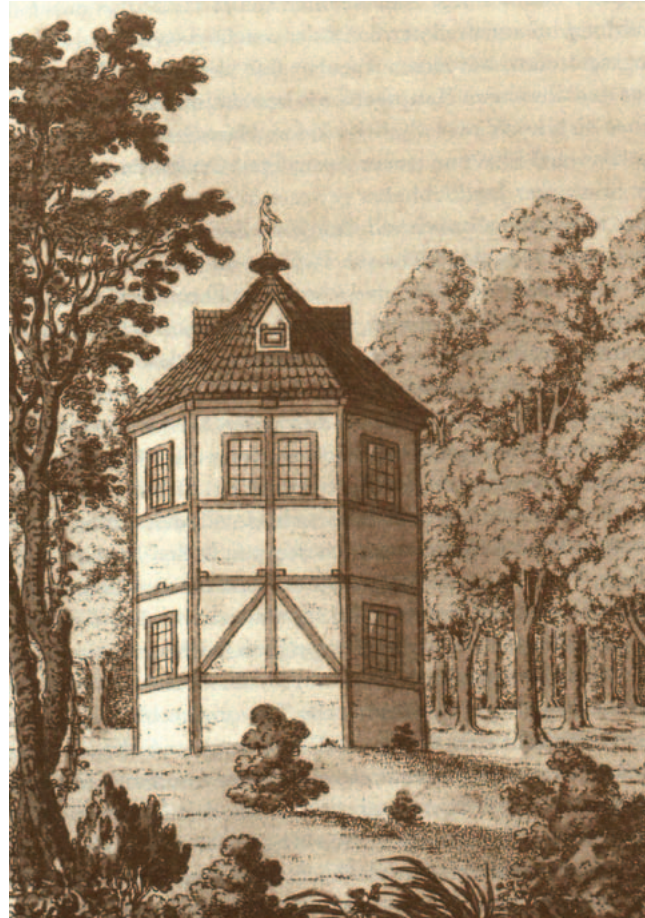
Der Tempel in der Granitz um 1805

Auf dem gegenüberliegenden Fürstenberg, dort, wo heute das Jagdschloss steht, errichtete Moritz Ulrich I. zusätzlich einen achteckigen Turm. Dieses auch als Tempel bezeichnete Belvedere gestattete einen weiten Blick über die Granitz. Das zweigeschossige Fachwerkgebäude schloss mit einem Pyramidendach ab, dessen Spitze durch eine Figur gekrönt war.