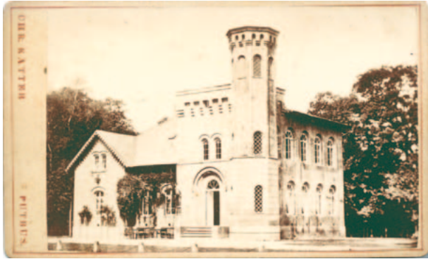
Forst- und Gasthaus um 1885

In den Jahren 1852 und 1853 wurde das Jagdhaus komplett abgerissen und dafür am heutigen Standort das "Gasthaus Granitz" erbaut, das zunächst jeweils zur Hälfte Forst- und Gasthaus war. 1891 verlegte man die Försterei in das Torhaus Lancken (heute Ortsteil Blieschow - Sitz des Amtes für das Biosphärenreservat Südost-Rügen).